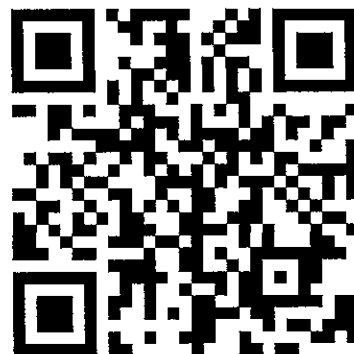
新規登録 QR コード

ログイン後、登録したお写真が画面右上に表示されます。クリックするとデジタル会員証が開きます。編集もそこから可能となります。